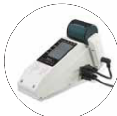
遠隔操作ユニット