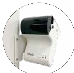
サーマルプリンター